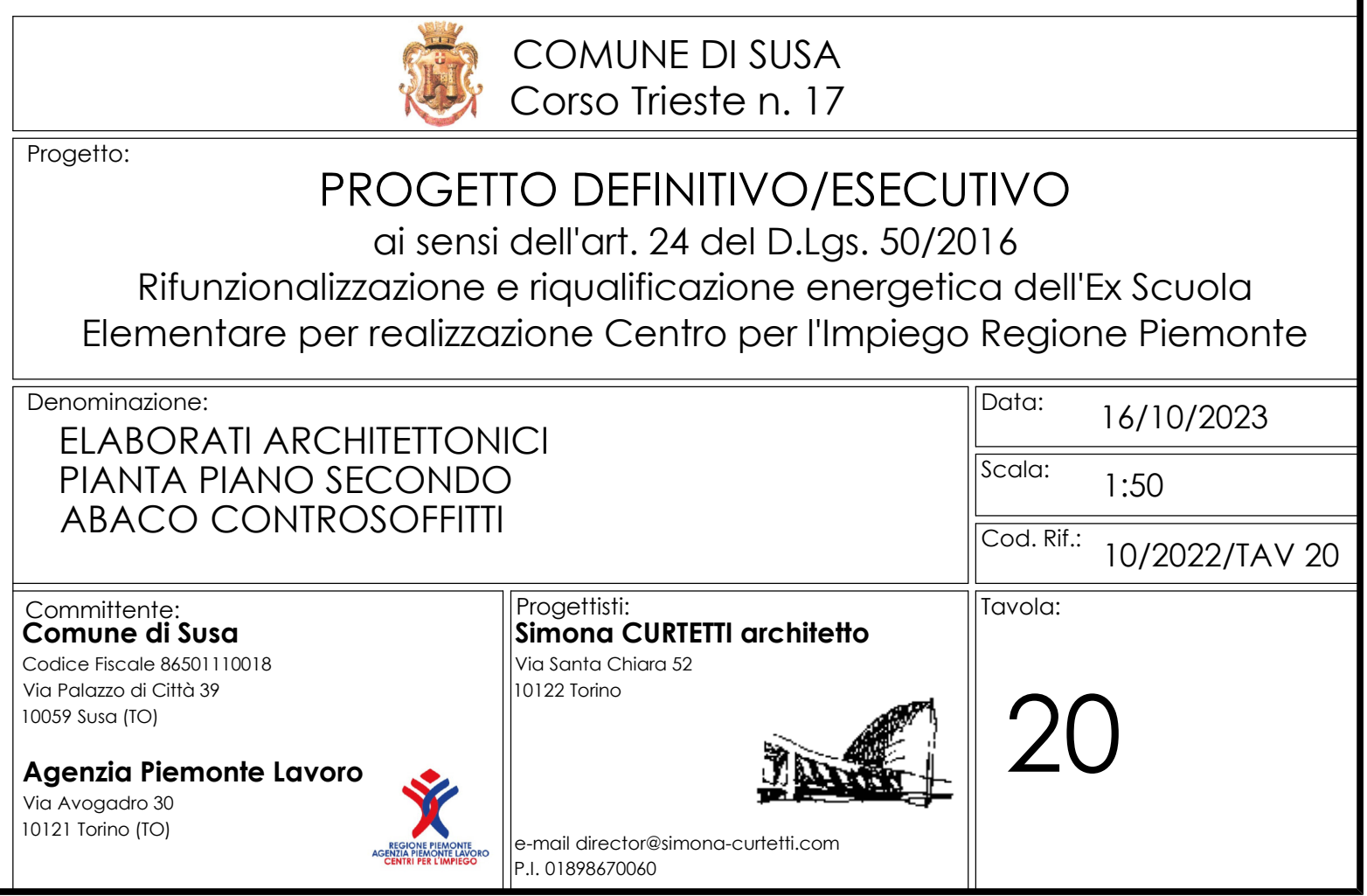
PIANTA PIANO SECONDO